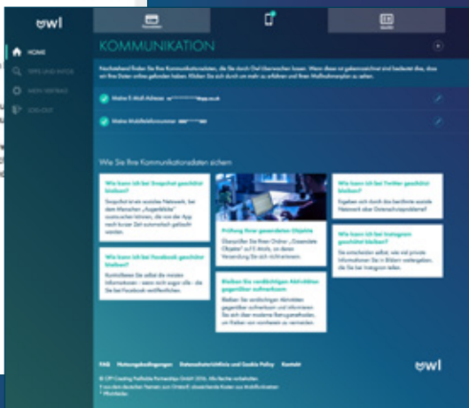
Abb 2: Übersicht hinterlegter Kommunikationsdaten