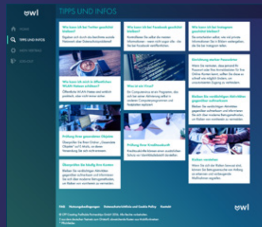
Abb 3: Tipps und Infos zur Sicherheit im Netz